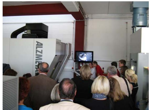
Besichtigung der Fertigung